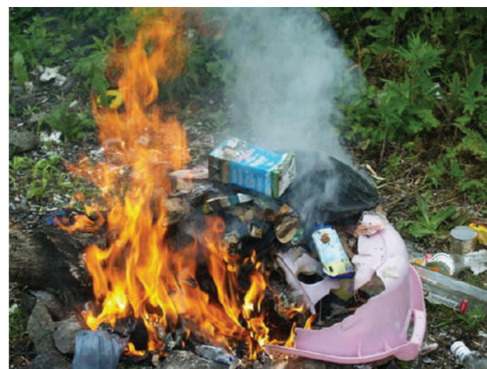
Мусор всюду горит одинаково и последствия плохие для всех

Недавно забравшись на высокую точку среди холмистой местности, что простирается от Назрани до Ачалуков, мы изучили богатое разнообразие трав, покрывающих эти места после обильных дождей. Многие из них жители Ингушетии, как, впрочем, и в других регионах России, покупают на рынке или в аптеке, между тем, все это богатство лежит буквально под ногами. Чабрец, тысячелистник, душица – от пряных запахов здесь пьянеет голова. Мы все больше погружаемся в мир виртуальных технологий, пластика и продуктов в вакуумной упаковке, и все больше теряем знания о природе, флоре и фауне родного края. А ведь именно хорошее знание их и естественный интерес к ним, лучше всего воспитывают в человеке желание и стремление беречь реки и озера, родники и водоплавы, плодородные земли, красивые цветы и редких животных. Просто искать способы сохранить чистым этот мир, в который ты пришел на время, и в который придут другие люди после тебя. Позом всякая картина, нарушающая эту гармонию чувств, тревожит и печалит. Мы увидели с этой высоты, стоя среди зелени трав, как там, вдалеке, слева от города Карабулака, за окраиной с.Плиево дымится мусорная свалка. Белый дым с черными полосами – так горит бытовой мусор, в котором много пластмассы и резины – в знойный день начинал стелиться по горизонту. Дым этих мусорных пожаров мучит, достигает людей на больших расстояниях.