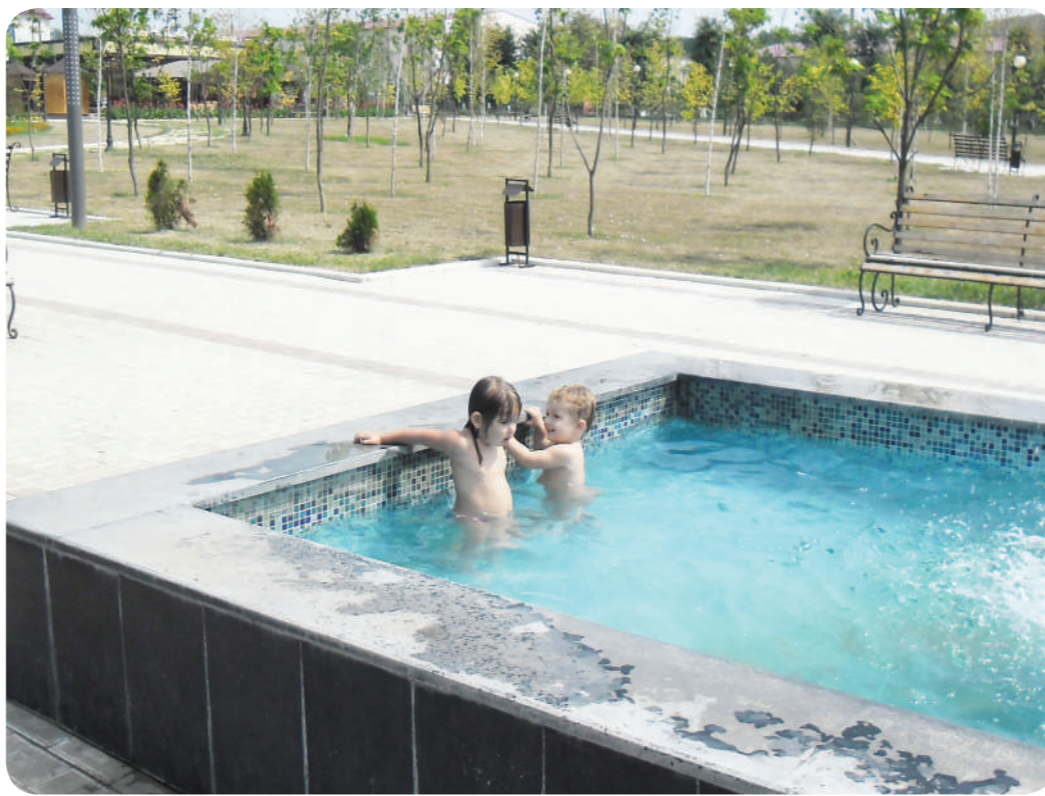
В Ингушетии продолжается сезон жары. К сожалению, у нас нет ни естественных, ни искусственных водоемов с благоустроенными пляжами...