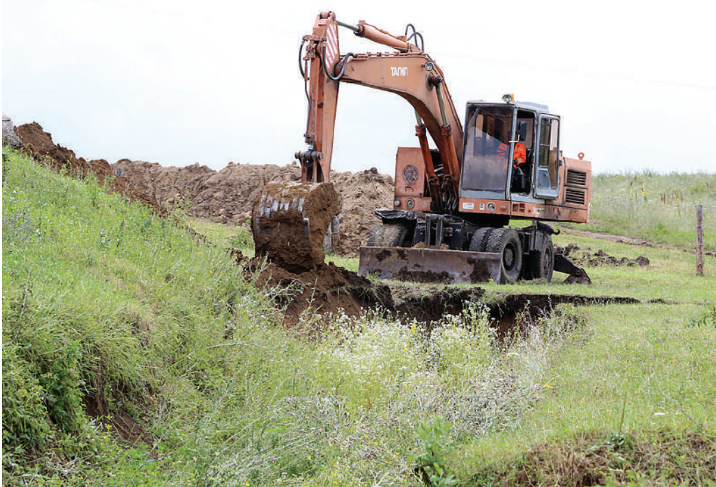
Глава Ингушетии Юнус-Бек Евкуров посетил два населенных пункта Сунженского района - Алхасты и Аршты. Он решил на месте изучить проблему водоснабжения сел. Чтобы охватить все домовладения и другие сельские строения, здесь понадобятся пробурить новые водные скважины.