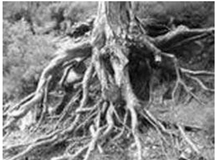
Сохранившиеся деревья держат почву, берега рек и ручьев, словно арматура, сохраняя их от размыва. Расстильность – это зонт, оберегающий почву. Она принимает на себя ливневую воду. Корни, словно заботливые руки, миллионы пальцев держат почву. Деревья оберегают почву от ветров, регулируют ее влажность, защищают от жары и холода.

Папуа – Новой Гвинее. Везде наступают на одни и те же грабли. Они фактически уничтожают, по неведению, скатерть-самобранку под ногами – земля всегда хороши урожай даст, если за ней с терпением и умом ухаживать, почву беречь. Трудно и у нас дома, в Ингушетии, за тысячи километров от далекой Колумбии, не заметить неистребимую привычку «расчищать жизненное пространство». Селится новый человек на сельской улице и почему-то первым делом начинается поголовная вырубка всей растительности, которую прежние хозяева растили несколько лет. Смотришь, не прошло и месяца, а на улицу валюток многолетних орех, срубленный под корень, виноград, айву, черешню, что угодно, лишь бы «эстетические вкусы» хозяев не портится. Конечно, частный двор, и человек, который то и делает, но эта типичность мышления, небрежное отношение к живому и возвращенному, очень тревожит. Мы говорим о том, что надо детей приучать к бережному отношению к природе, а на деле ребенок видит, что нет даже у родителей этого элементарного уважения к бесценной флоре. Посмотрите на берега Сунжи, этого потока родниковой воды, пересекающей большую часть республики. В с.Альтиево, в с. Барсуки или в г. Карабулаке обычное дело слышать о том, какой красивый вид открывается на