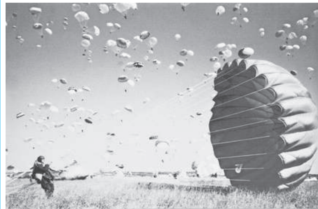
История в фотографиях. Воздушный парад в День авиации - 6 марта 1948 г. Приземление парашютистов на Тушинском аэродроме

на счету которых тысячи прыжков, участником зрелищного мероприятия тогда стал и Юнус-Бек Евкуров. Подавая пример всем остальным, он совершил два