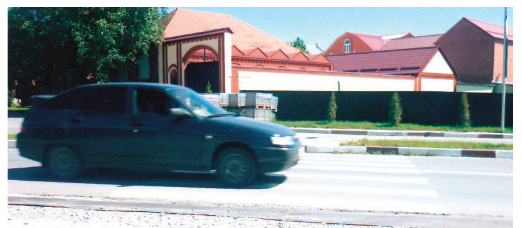
г. Назрань, по ул. Сулейманова не пройдешь...

Я, автор этих строк, живу (на улице Плиева, 6) в 40 метрах от расчерченного белыми полосами перехода для пешеходов, что на улице Сулейманова. Каждый раз при переходе этой полосы опасаясь быть сбитым автомобилями, которые проносятся здесь порою со скоростью 100 и выше километров. Особенно эту полосу с большим трудом приходится преодолевать детворе, школь-