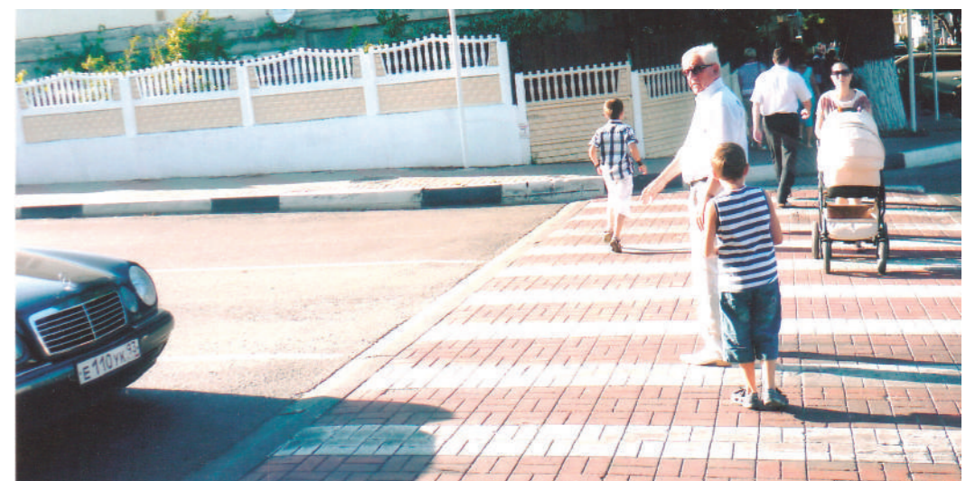
В Геленджике: я и внуки проходим дорожный переход безбоязненно

Приехав недавно на отдых в курортный город Геленджик, не мог не обратить внимание на то, как перед каждым переходом улиц без светофоров различные автотранспортные средства аккуратно, как по команде останавливались, чтобы пропустить пешеходов, после чего только продолжали движение. Я со своей командой внуков безбоязненно проходил эти переходы, не опасаясь быть сбитым. Да это и понятно, в таких местах, с нанесенными белыми линиями, согласно правилам дорожного движения преимущество имеют и то, и другое, но от этого пешеходам не легче, они боятся быть сбитыми дисциплинированными водителями, которых немало на наших улицах. Казалось, порядок и дисциплина в этом направлении по долгу своей службы обязаны установить сотрудники ДПС, наделенные правами, жестко пресекая таких нарушителей в административном порядке - различными штрафами вплоть до изъятия водительских прав. Не могу сказать, что это не делается, однако, как видно, недостаточно. Для подтверждения вышесказанного приведу примеры.