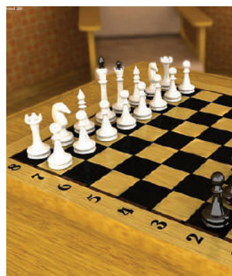
В поселке Пойковский Ханты-Мансийского автономного округа проходит 14-й