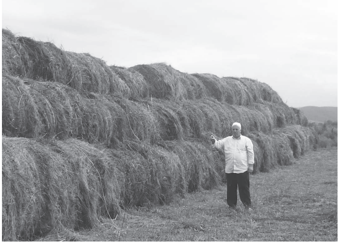
КРС нет равных не только среди КФХ, но и среди сельхозпредприятий, в которых, заметим, КРС катастрофически сократился из-за известных лихих реформ 90-х годов.

Наконец, фермер привез меня на свое ранчо, расположенное с левой стороны у въезда в Малгобек. В огороженной со всех сторон центральной усадьбе КФХ расположен машинно-тракторный парк, где стоят семь единиц колесных «Беларус», два «Кировца», четыре КАМАЗА, бульдозер, комбайн «Енисей», подготовленные для полевых работ – уборки кукурузы, закладки силосной массы, пахоты земли для предстоящего сева