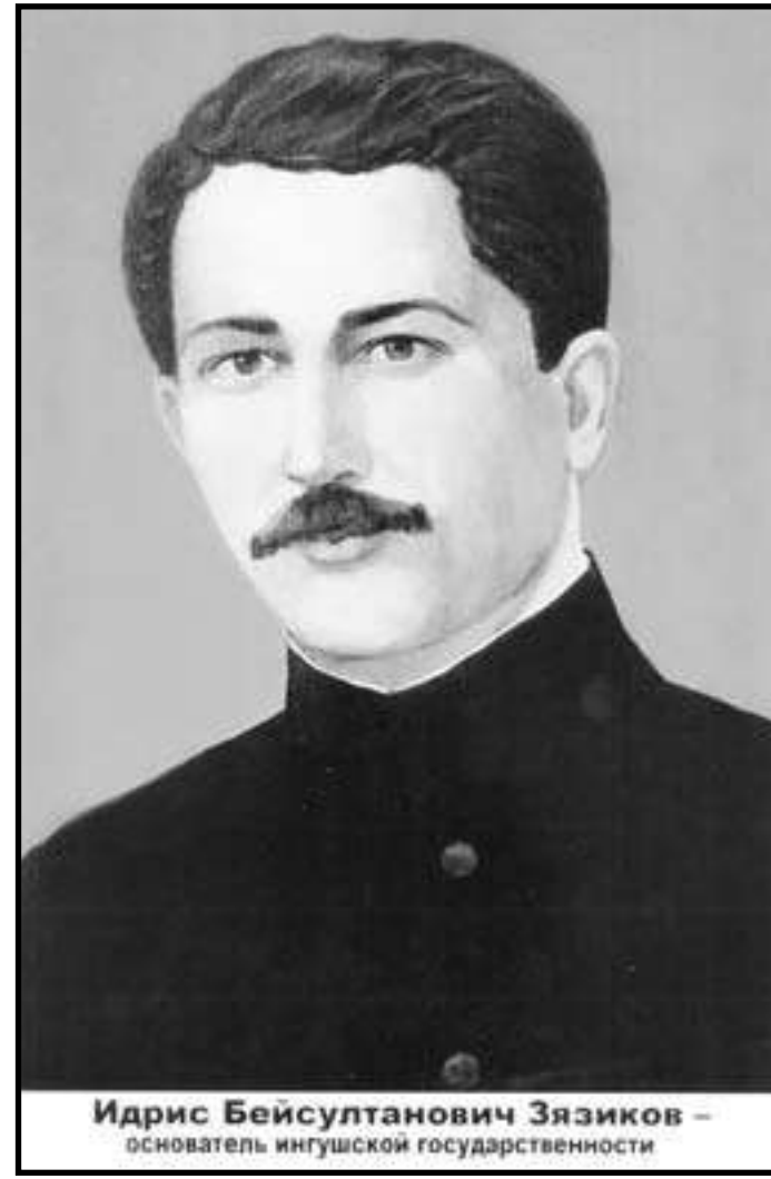
Идрис Бейсултанович Зязиков — основатель ингушской государственности

щие заводы Новороссийской группы, обладающих к тому же наиболее мощными сырьевыми запасами лучшего качества и по своим производственно-техническим возможностям являющиеся наиболее мощными.