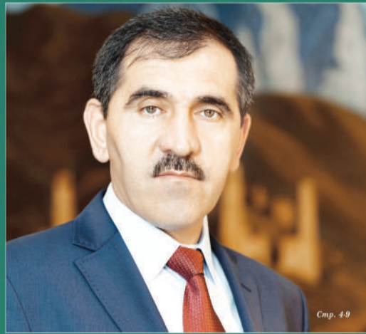
ЮНУС-БЕК ЕВКУРОВ, Глава Республики Ингушетия:

«ГЛАВНЫЙ ПРИОРИТЕТ - КАЧЕСТВО ОБРАЗОВАНИЯ НАШИХ ДЕТЕЙ!»