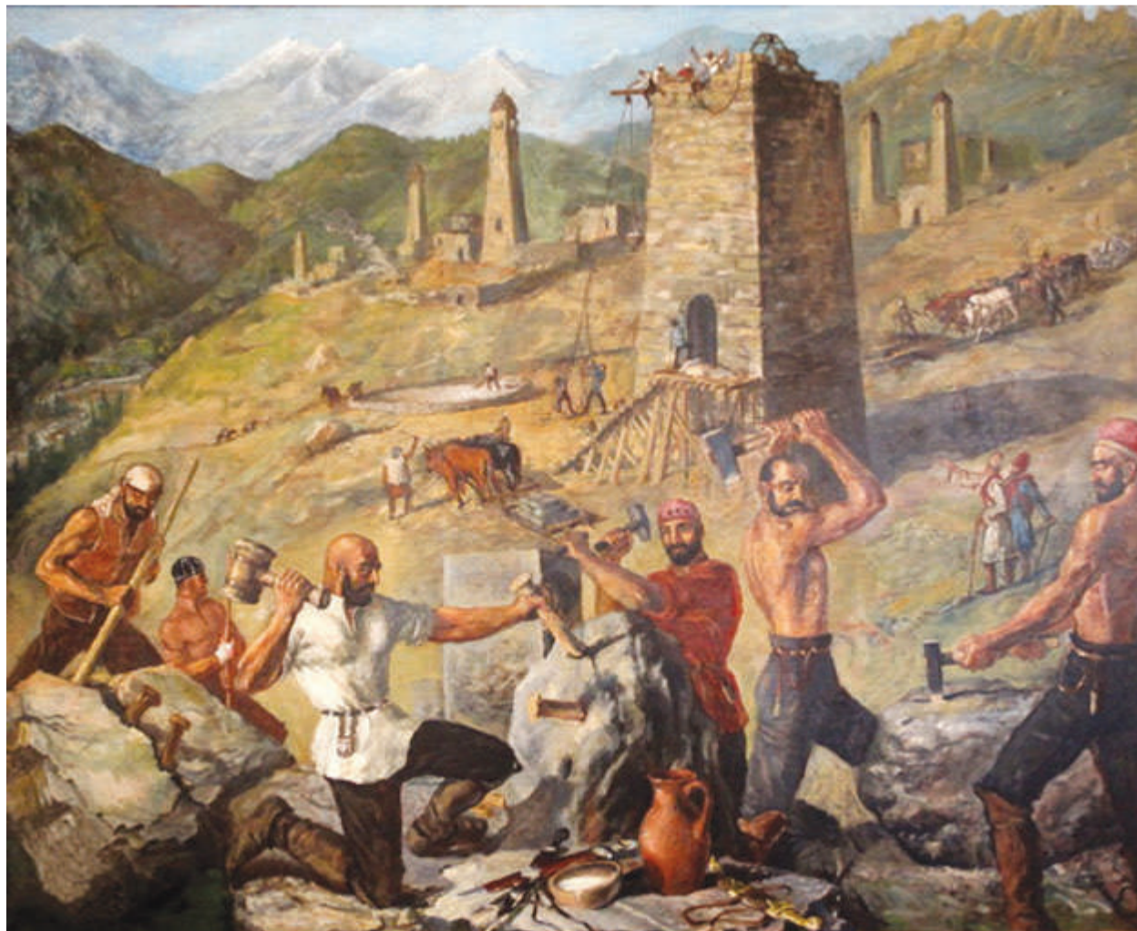
Х-А.Имагожев "Глалаш йоттар"

Имагожева кхоллам айхха бувзабенна ба вай