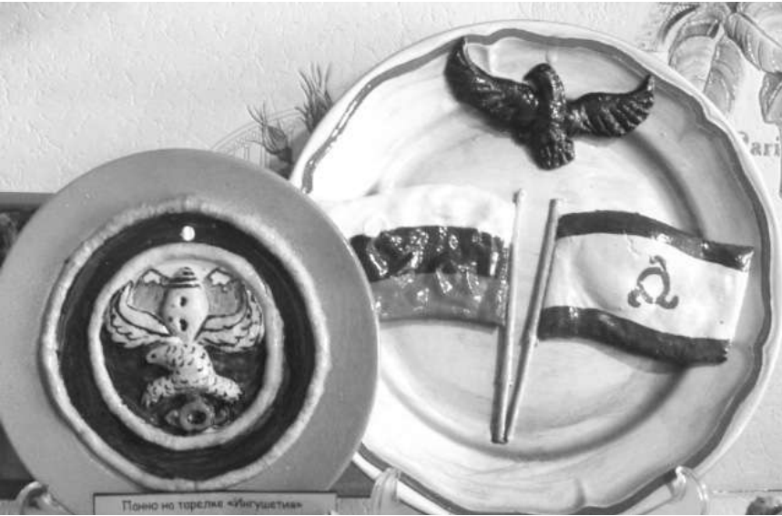
соленого теста «Мой горный край в недалеком будущем» никого не оставил равнодушным. Активная

Внимание всех присутствующих было приковано к выставке изделий детского художественного творчества, развернувшейся перед сельским ДК, в котором проходили торжественные мероприятия. В подготовке выставки приняли участие все образовательные учреждения района. Более 100 лучших подделок работ воспитанников Центра творчества детей и юношества Джейрахского района различного жанра были представлены на выставке: изделия из соленого теста, природного материала. Гости района были приятно удивлены не только разнообразием изготовленных изделий, но и прежде всего тем, какой любовью к своему прекрасному краю были пронизаны работы джейрахских детей. В витринах оживали прекрасные горные пейзажи, а панно из