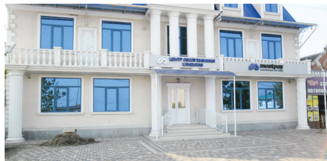
А. ИНСАРОВ Фото автора

Чтобы заплатить за коммунальные услуги, им пришлось ехать в райцентр. Теперь это можно сделать через терминалы, которые мы установили в зданиях, где расположены сельские администрации. За газ можно платить вообще не выходя из дома. Мы заключили договоры с контролерами «Межрегионгаза», обеспечили их необходимыми приборами и теперь они прямо у вас на дому могут показать вам ваши данные, принять оплату и выдать квитанцию из аппарата, а не написанную от руки. Здесь какие-либо махинации просто невозможны. Абонентам это удобно, контролерам — 2% от суммы собранных платежей. Задолженность по коммунальным платежам — большая проблема, ею озабочено и руководство республики. Создание этой новой структуры, несомненно, будет способствовать хотя бы частичному ее решению.