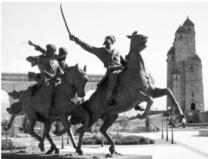
возможности продвижения императорской армии.

По его мнению, 1915-1916 гг. - самые яркие в истории Воинской славы ингушей. Интересным фактом, на его взгляд, служит то, что полк Дикой дивизии пополнился пять раз новыми участниками, и он участвовал в самых сложных военных операциях, там, где блокировалась