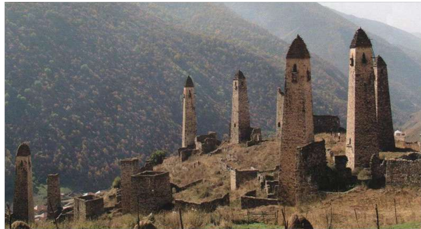
Башенный комплекс Эрзи

Развитие мелкотоварного производства в Джейрахском районе, включая возрождение народных ремёсел, с использованием пустующих площадей заброшенных башенных комплексов в бедных горных сёлах с размерами у основания от 82 кв.м в башне-убежище Магой Джел (Пастушья башня) и 142 кв. м в башнях Таргим и Эрзи, высота которых достигает 21 м, позволяет организовывать выставки-продажи изделий местных промыслов, предметов горного туризма, места питания экзотическими плодами, производство и реализацию блюд местной экологически чистой кухни (рис. 1).