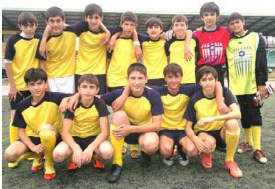
Надемся, что и в будущем году наши юные футболисты порадуют нас в этом виде спорта!