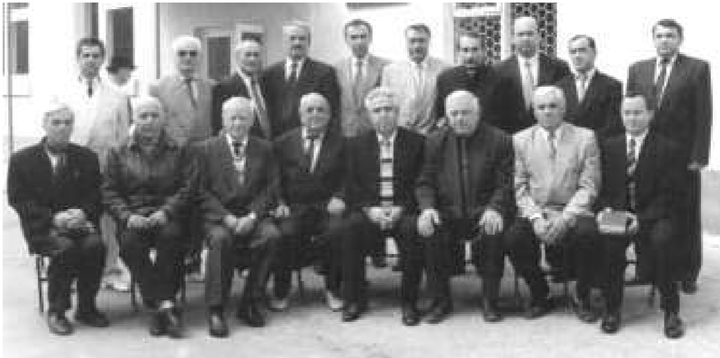
Профессорско-преподавательский состав института экономики и права в Дагестане с представителями общественности республики. 1998 г.

Наверное, кто-то думает, что за пределами республики можно получить какое-то особое образование. Но это, безусловно, заблуждение - все вузы России работают по единым учебным программам и отвечают одним государственным об-