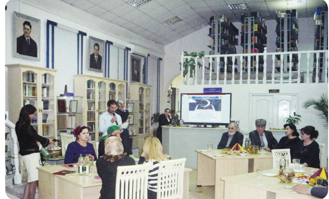
антологеш: «Са дошо Г'алг'айче», «Наьнах дола дош», «Са наьна мотт». Из дика г'о да, х'ана аьлча цу