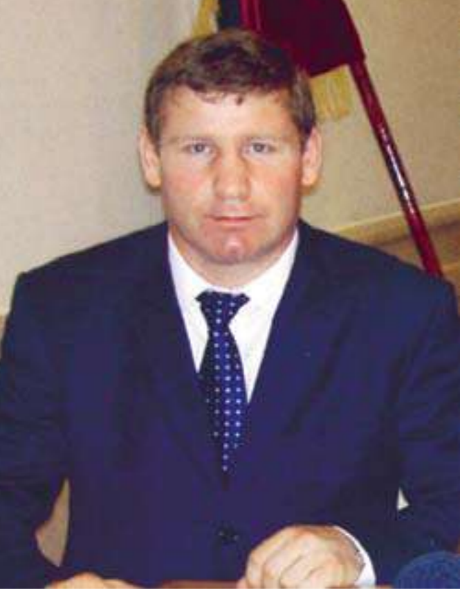
СУЛТАН ИБРАГИМОВ, первый среди дагестанцев чемпион мира по боксу по версии Всемирной Боксерской Организации (WBO)

В 1897 г. в Темир-Хан-Шуру приехал на гастроли из Санкт-Петербурга цирк. В отличие от нынешних времен «гвоздем» цирковых представлений были тогда схватки борцов, особой популярностью пользовались схватки тяжеловетов. В приехавшем цирке были два знаменитых силача – турок Кочи-Ахмед и россиянин Корш.