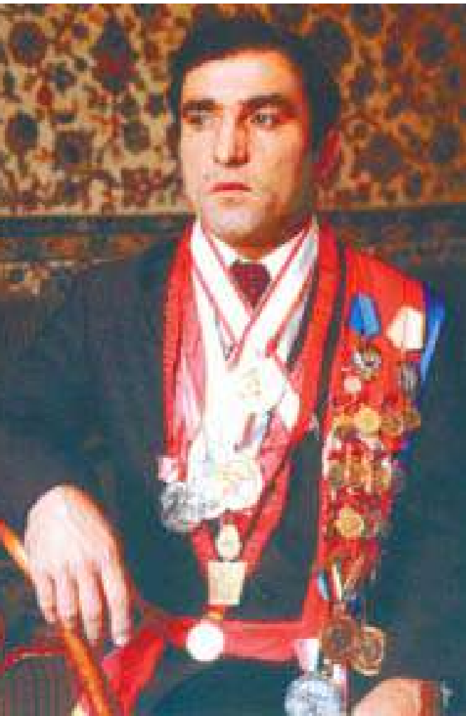
АЛИ АЛИЕВ, прославленный спортсмен, пятикратный чемпион по вольной борьбе

Дорогу же к пьедесталу чести международных соревнований дагестанским борцам проложил прославленный советский борец Али Алиев – пятикратный чемпион мира, призер Олимпийских игр. Занятия