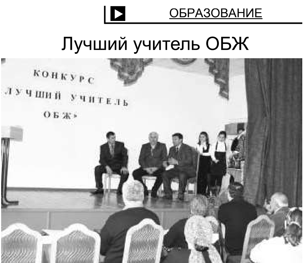
Главное управление МЧС России по Республике Ингушетия в сотрудничестве с министерством образования республики подвело итоги муниципального этапа конкурса «Лучший учитель ОБЖ-2011»

- Давайте начнем с государственных унитарных предприятий, входящих в