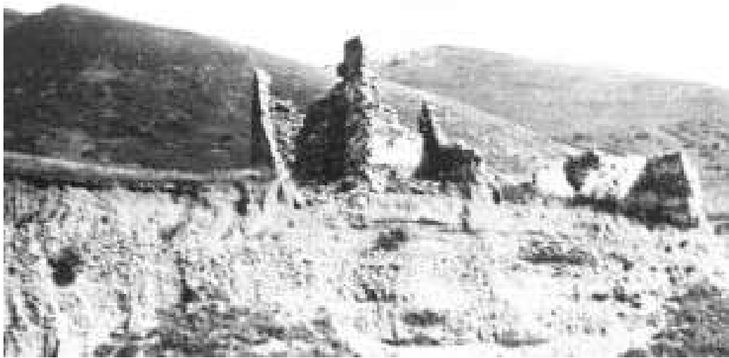
Развалины Измаил-цengi. 1912 г

свободу» (записано в 1921 г.). Очень интересно закливание, относящееся к тому же обряду, приводимое более ранним исследователем Б.Далгатом (1893 г. «Терский сборник», вып. III, кн. 2, Владикавказ, 1893 г.): «Да будете вы, солнце, луна и такой-то (имя почетнейшего члена фамилии из живых) на этом свете и такой-то (имя уважаемого из мертвых) на том свете свидетелями, что ты приносишь мне присягу в незнании о случившейся у меня кражи. Если же ты совершил кражу и принимаешь ложную присягу, то да перенесутся на наших родственников, покоящихся в этом каше, все