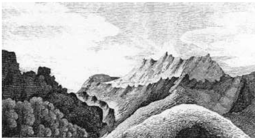
View of the K. Kазбек из Владикавказа. 1826 г.