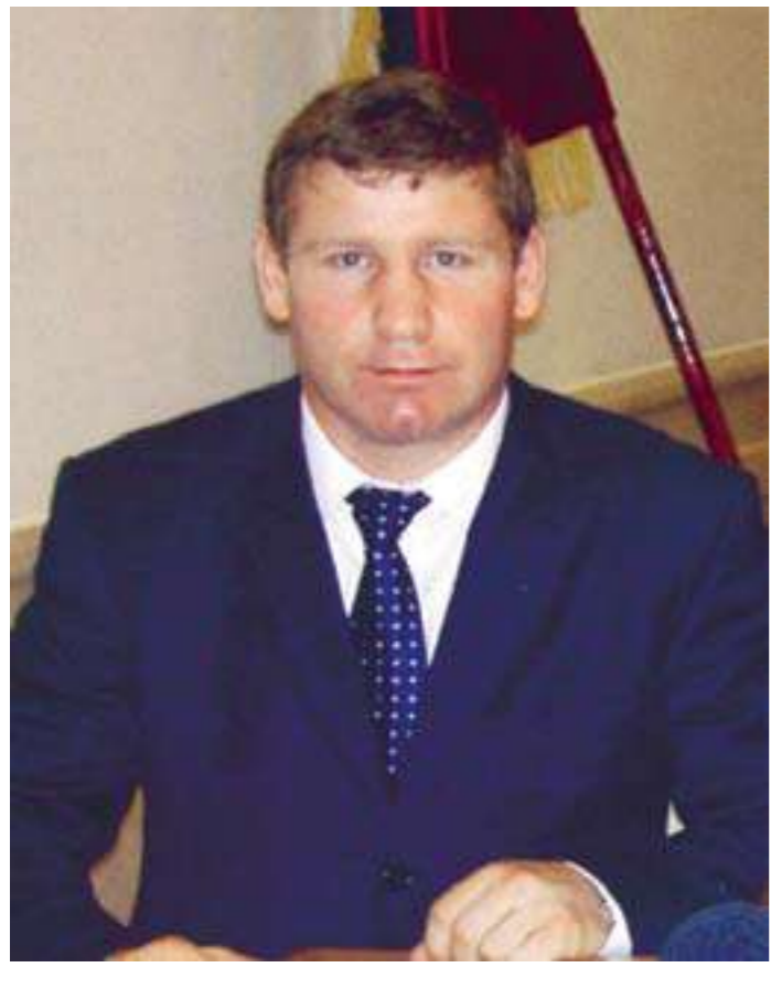
СУЛТАН ИБРАГИМОВ, первый среди дагестанцев чемпион мира по боксу по версии Всемирной Боксерской Организации (WBO)

жающих. В 1897 г. в Темир-Хан-Шуру приехал на гастроли из Санкт-Петербурга цирк. В отличие от нынешних времен «гвоздем» цирковых представлений были тогда схватки борцов, особой популярностью пользовались схватки тяжеловесов.