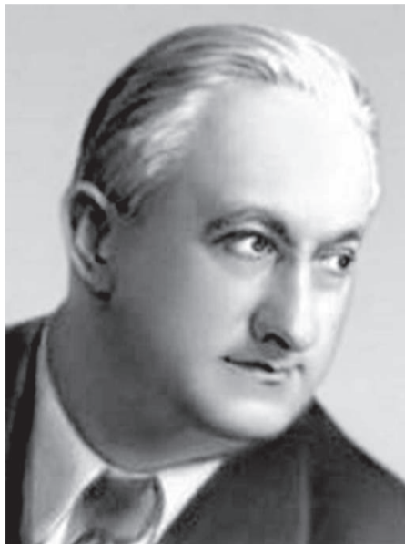
Вано Ильич Мурадели (1908-1970) советский композитор, актер

Конечно, не обошлось без выступлений единомышленников Берия, которые одобряли выселение ингушей и чеченцев. В итоге посчитали, что произведение антинародное и наносит ущерб дружбе народов. После обсуждения