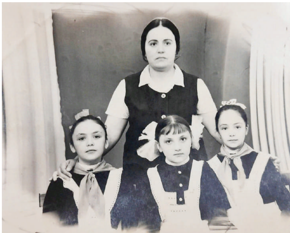
Мама и три ее дочери