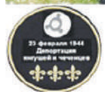
Международная акция : Сигнальные огни на башнях-2021 Ницца, Франция