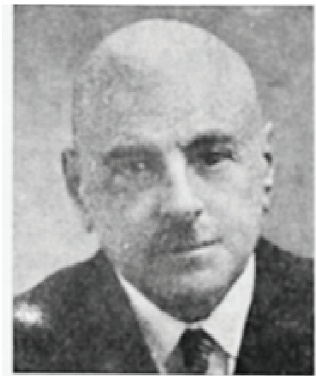
Н. Н. БРЕШКО - БРЕШКОВСКИЙ