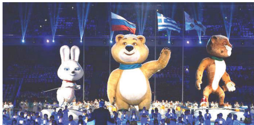
Закрытие Олимпиады в Сочи вызвало восхищение и восторг миллионов людей

Сначала отличились мужчины, которые по итогам марафонской 50-километровой дистанции у лыжников оккупировали весь пьедестал почета. Первым стал Александр Легков, представляющий Ханты-Мансийск. Менее секунды ему уступили остальные призеры: «серебро» у Максима Вылегжанина из Удмуртии, а «бронза» досталась новосибирцу Илье Черноусову. Россия в медальном зачете стала недосягаемой.