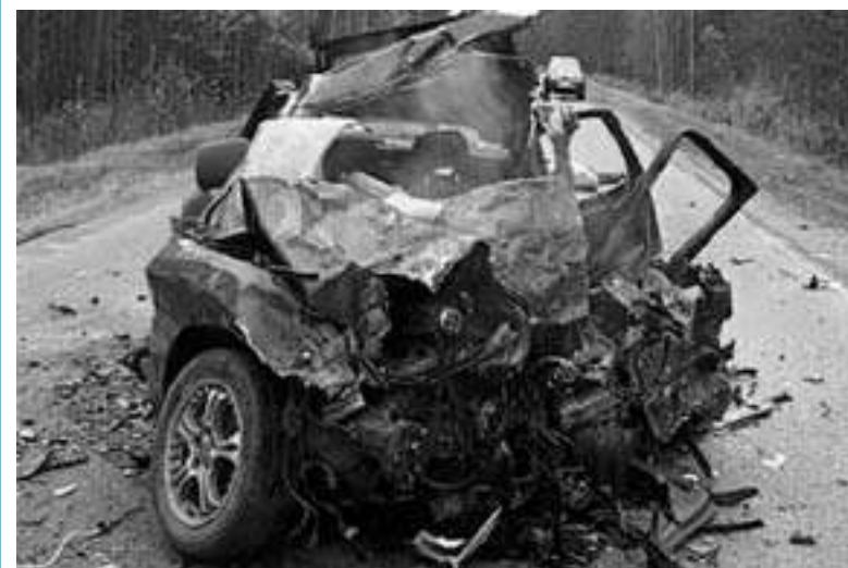
Количество аварий в России продолжает расти. Каждое ДТП - большая человеческая трагедия.

- В 99 процентах случаев причиной аварий является превышение скорости водителями транспортных средств, - говорит начальник ГИБДД МВД РФ по РИ полковник полиции Алаудин Накостхоев. - В этой связи считаю необходимым обратиться к участникам дорожного движения, представителям общественных и молодежных организаций и духовенства содействовать формированию культуры безопасного поведения на дорогах, уважительного отношения к закону и правам людей. Мы просто