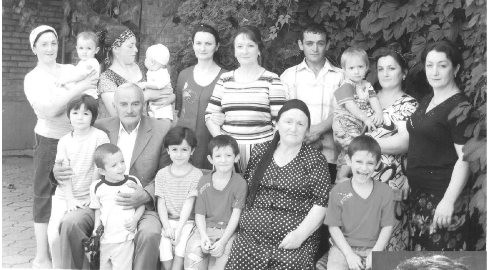
Овшанакъан Хасолта Кьамбулати Муцолганакъан Салмана Раяи шоай дезалца а царех хьабьннарашца а

Цу тайпара ши машен вIашагIкхийттар, уж Iочубигаб Шолжа больнице, шиннена а лорий хьалхара новкьостал дир, цул тIехьагIа амбулаторера дарба а хьожадир.