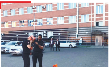
КХЕРАМЗЛЕ Ученешка дакъа лаьцар полице болхлоша