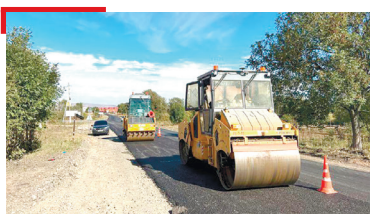
НАВКЪАШ ГалгӀайчен навкъа служба болхлоша Экажево-Али-Юрт никъ тоабеш латт