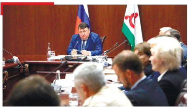
ГӀАБДАЛ Проекташ чакхъяхара гӀулакха эггара хьалха латт вай республика

1973-ча шера «Сердало» газета «Знак почета» яха орден еннай