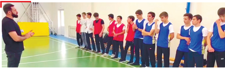
СПОРТ ГалгӀайче дӀахьош я, регионални лиге «Basket game» турнир