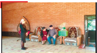
СОВГИАТ Шолжа-пхьера къоаной дакъьалбийцар