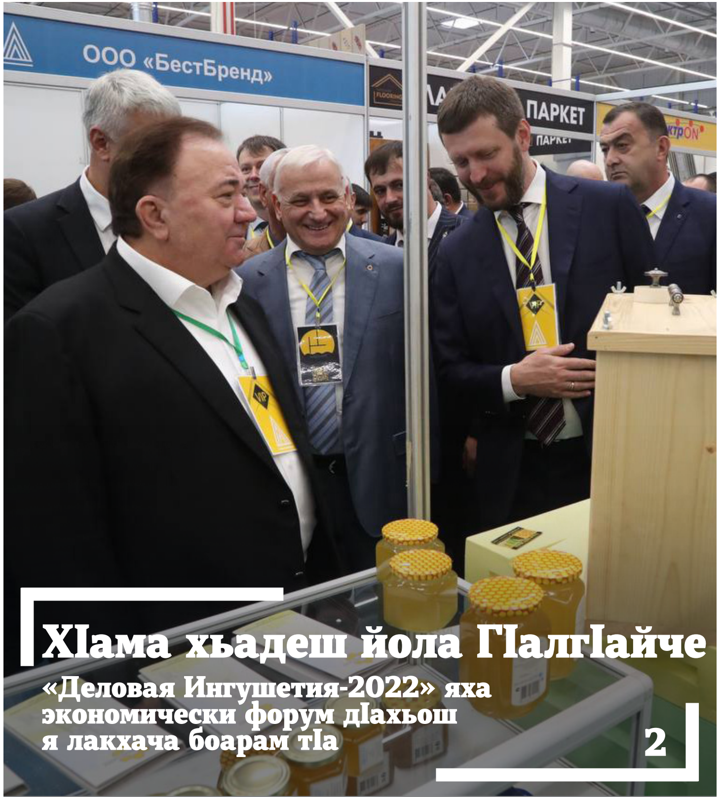
ХӀама хьадеш йола ГӀалгӀайче «Деловая Ингушетия-2022» яха экономически форум дӀахьош я лакхача боарам тӀа

www.serdalo.ru | Дзен сердало | vk.com/gserdalo | @gserdalo