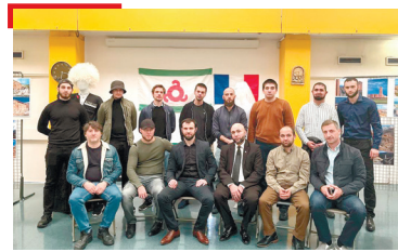
ГОЙТАМ Парижерча гӀалгӀаша межках лаьца гойтам дӀабихьар