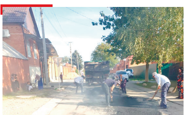
ГӀАЛИЙ ТӀАРА ХЪАЛ Назранера навкъаш дикача хьале дерзаргда