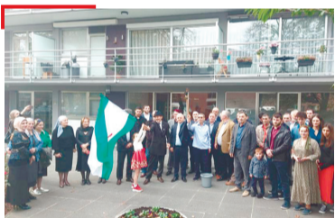
АКЦИ «Галаш тлара цлешаш» яха акци длаийхьар, доазол арахьарча гІалгІаша