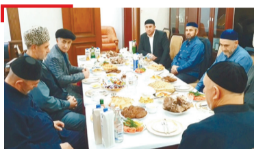
ДАГАЛОАТТАМ Магаса мэре дагабехар, хатара юкье байнараш