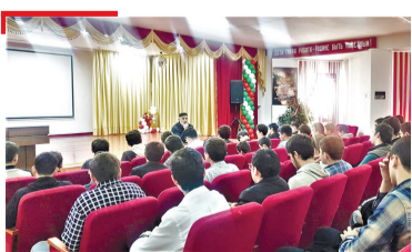
КХЕТАМЦА КХЕДАР Кагирхошта дийцар сакхетам дегІабоалабарах