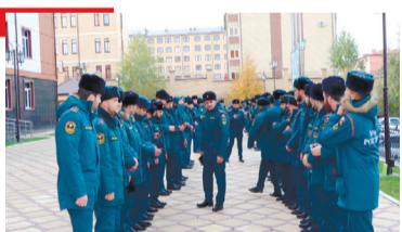
КХЕРАМЗЛЕ МЧСа балха мугІарий кийчонга хьажар