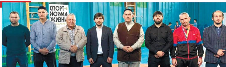
СПОРТ Галашкерча ФОКа керда борцовски клубсаш делар