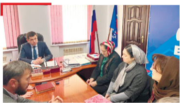
ЮКЪАРЛО «Единая Россия» парте доакъашхой, нах тлаийбеш хилар