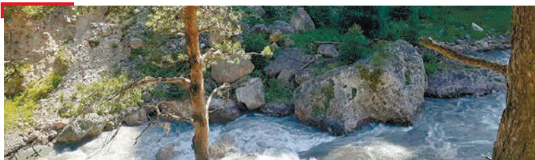
ЭКОЛОГИ Натуралистий кхуврч ший болх длахьош ба