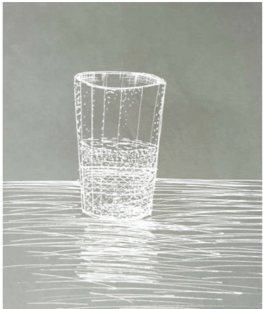
прочитал в одной маленькой книге.