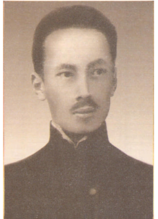
лава 2-й ст. Похоронен был в родном селе Длинная Долина с воинскими почестями.

Удостоен следующими орденами: святой Анны 4-й ст. с надписью «За храбрость», святой Анны 3-й ст. с мечами и бантом, святой Анны 2-й ст. с мечами, святого Владимира 4-й ст. с мечами и бантом, святого Владимира 3-й ст. с мечами и бантом, святого Станислава 3-й ст. с мечами и бантом, святого Станислава 4-й ст.