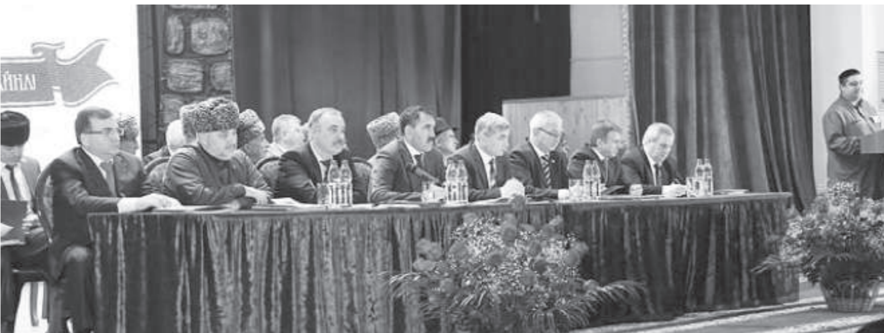
(Продолжение. Начало на 1 стр.)

На встречах мне задавали вопрос: почему ингушская сторона и возглавляемая мною комиссия по определению границ не освещает свою работу в СМИ. Упрекали в том, что мы не отвечаем адекватно на каждое высказывание чеченской стороны. Я ответил им и ска-