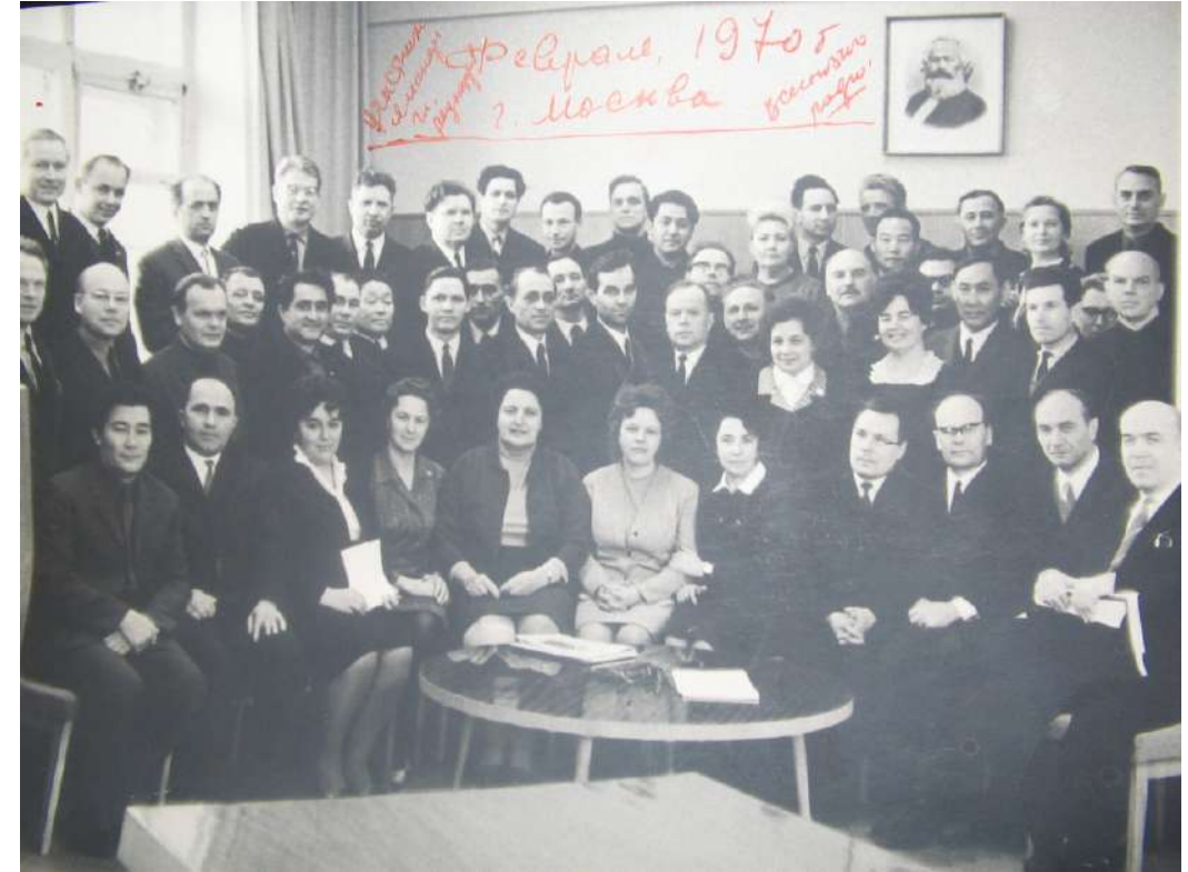
На снимке: среди участников семинара главных редакторов Всесоюзного радио. (Первый ряд второй слева)