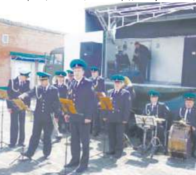
Джейрахский район самый спокойный в республике.

В начале апреля 2001 года была сдана в эксплуатацию застава «Эзми», где на прошлой неделе отметили 10-летний юбилей.