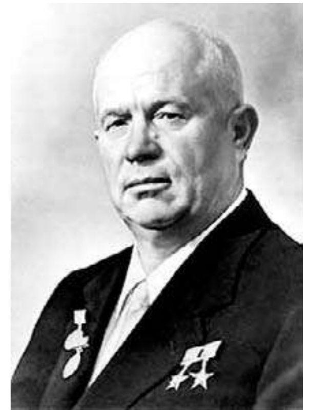
Хрущев Никита Сергеевич

В законодательном порядке необходимо решать вопросы о восстановлении «старых» границ территорий традиционного проживания народов, подвергшихся репрессиям. Решение этой проблемы осложнилось после подписания в 1992 г. Федеративного договора. Ведь он предусмотрел, а новая Конституция России подтвердила, что территория субъектов Федерации может быть изменена только по их согласию. Видимо, из этого общего принципа следовало бы путем толкования Конституции Конституционным судом сделать изъятие и допустить восстановление «старых» границ, даже если субъект Федерации, которому это невыгодно, возражает, когда речь идет о реабилитации репрессированных народов в форме возврата им ранее незаконно отнятых земель. Можно было бы также предусмотреть решение спорных территориальных вопросов российским третейским