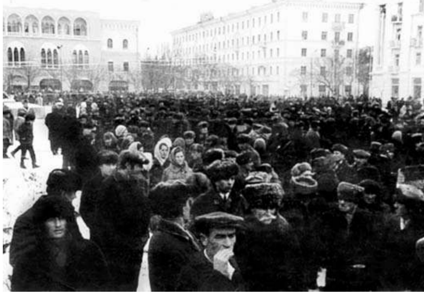
ОБЩЕГРАЖДАНСКИЙ МИТИНГ ИНГУШЕЙ 1973 ГОДА (г.Грозный)

Несмотря на то, что Чечено-Ингушская АССР была восстановлена, Пригородный район, вопреки целому ряду нормативно-правовых актов, принятых на высшем правительственном уровне РСФСР и СССР, оставался в составе Северной Осетии. Населенные пункты бывшей Ингушетии