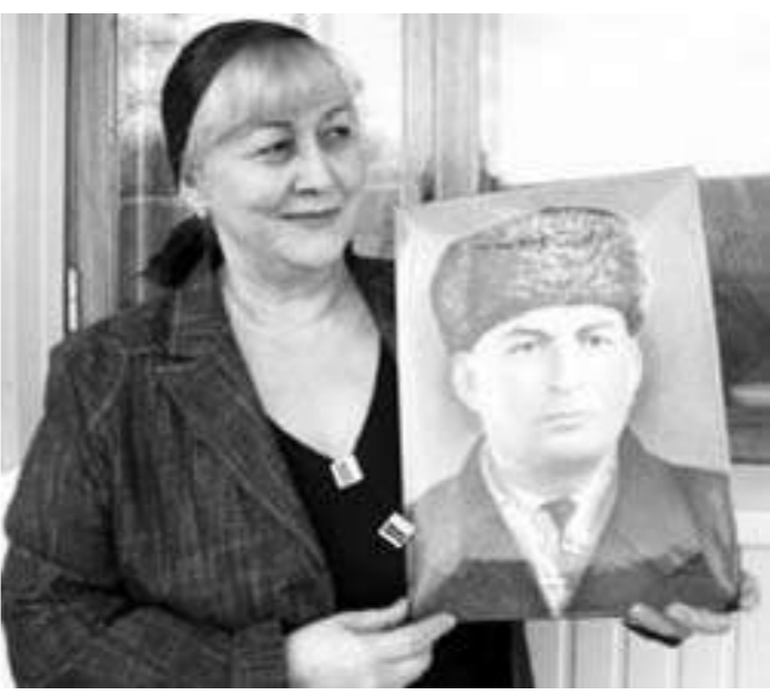
Сын и дочь отважного ингушского разведчика и сейчас живут в отцовском доме, построенном по указанию Юрия Андропова для его однополчанина