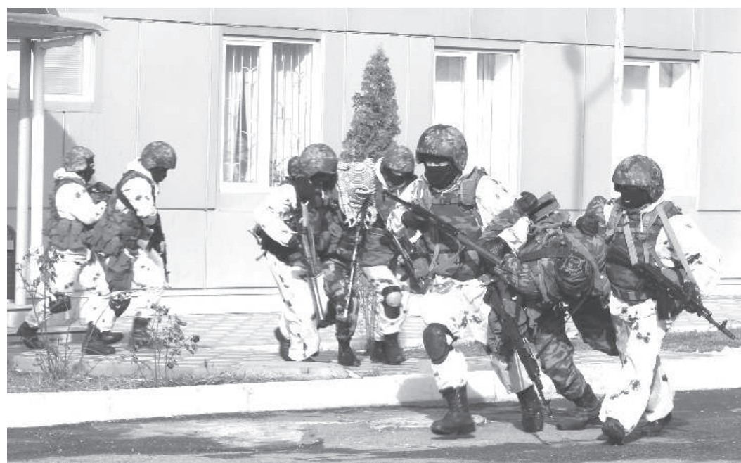
Во время учений