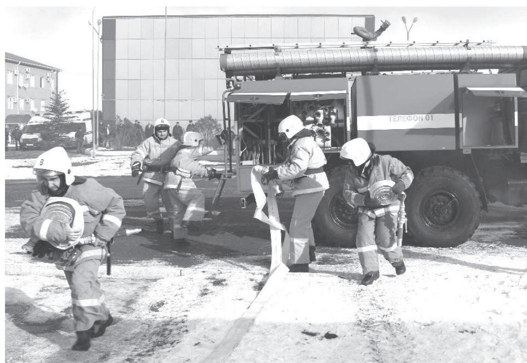
Всегда готовность №1!