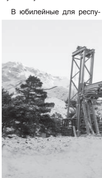
В юбилейные для республики...