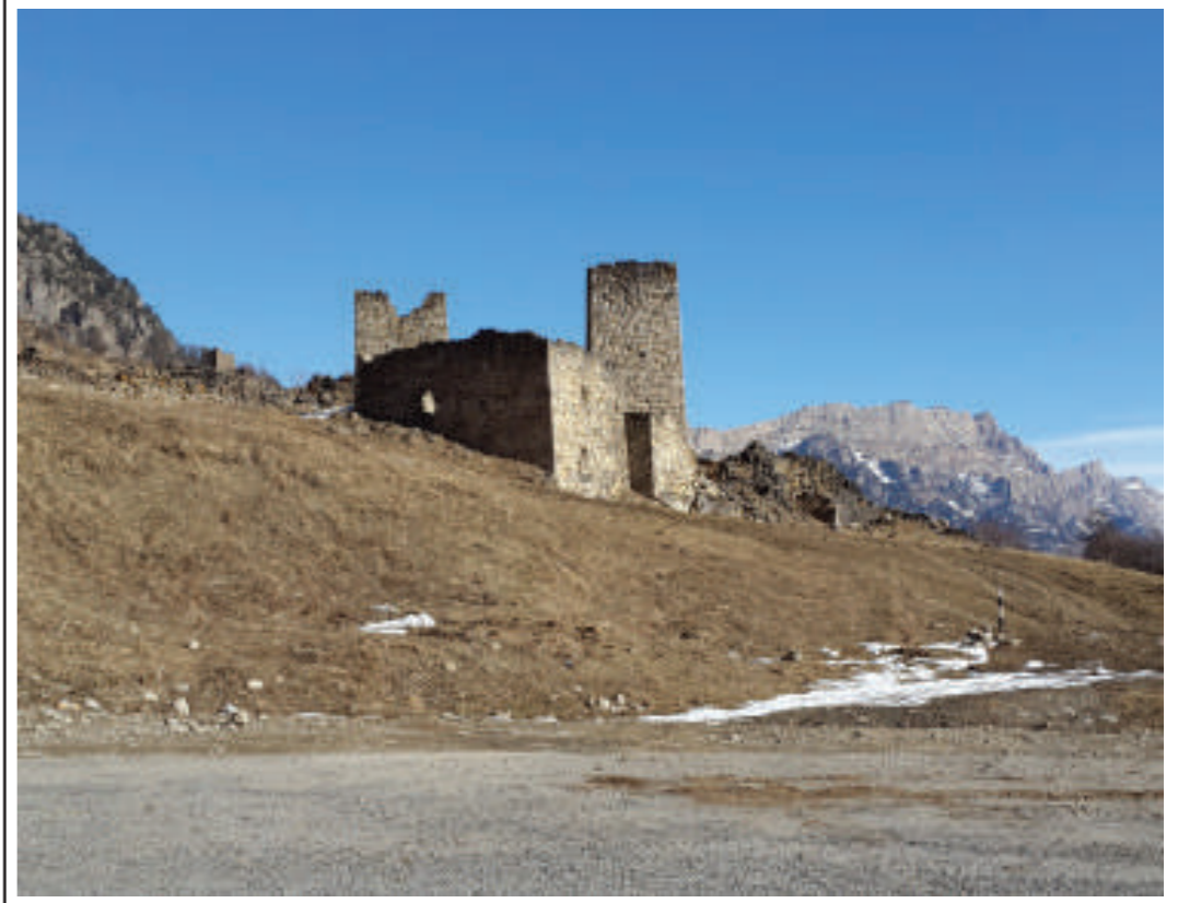
В горах Ингушетии