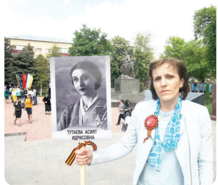
аспирантуру, а в середине июня этого же года блестяще защитила диссертацию на соискание учёной степени кандидата медицинских наук. Тема ее диссертации - «Олигодинамическое действие металлов в практике приготовления тифозных вакцин» - открывала широкий простор для дальнейших исследований. Очень быстро накапливая материал для докторской диссертации, молодой ученый успела за короткий срок выдать на гора более десятка научных работ. Вот назвала лишь нескольких из них: «О сроках годности тифозной вакцины, полученной воздействием бактериальных ионов металлов», «Жизнеспособность брюшнотифозной палочки в почве в условиях эксперимента», «Новый метод приготовления тифозной вакцины посредством обработки серебрено-марганцевой водой», «Олигодинамическое действие металлов», «Микробиологические исследования биохимических процессов гниения курорта озера Татарское Красноярского края»...

Я не буду подробно касаться ценности Вашей работы, скажу только, что все имеющееся в нашем арсенале вакцин страдающих целым рядом отрицательных сторон по реактивности и по сохранности. СМ-вакцины являются, несомненно, лучшими среди других. Хотелось бы пожелать, чтобы Вы с такой же настойчивостью продолжали исследования по внедрению препарата в практику. Указывая на эти положительные качества Вашей работы, я, кроме того, считаю необходимым отметить здесь еще одно обстоятельство. Будучи первым врачом Вашей родины, далекой окраины, которая послала