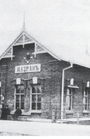
ЦIаьрaл цIеь зизаш дагIача цу моттиге аркьалви-же цьаь юьк йоакхар цо.

Пакьха, цьан кулга гола ю а гIортайги, гобакьха дIа-юха хьожар. Тамаш йора цо шийна гуча хозалах. Цьан-шин сахьата цига а хинна, хьехархоша морхIаш дизза зизаш а даьха, цIаьдяхар тхо. Иштта яр канала дехье. Нах кхооба оагIув санна яр из цу шерашка.