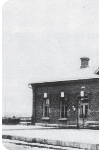
Мара яцар ерригача Наьсаре. Керттера яр Свободы (ХIанз С. Оксана), Ингушски, Асфальтни, Магистральни я оалараш.

Массежх уллица мара яцар ерригача Наьсаре. Керттера яр Свободы (ХIанз С. Оксана), Ингушски, Асфальтни, Магистральни я оалараш. Кхы мел яраш царех хьакхеташ, нах бахаш а цабахаш а яр. Цар керттера хилар а цьаьнца бахьанца дувазденна дар. Масала, Свободы яхача уллицо юварз Шолжа-Палий тIа йочухьаччалца мел даца юртш. Цул совгIа укхача