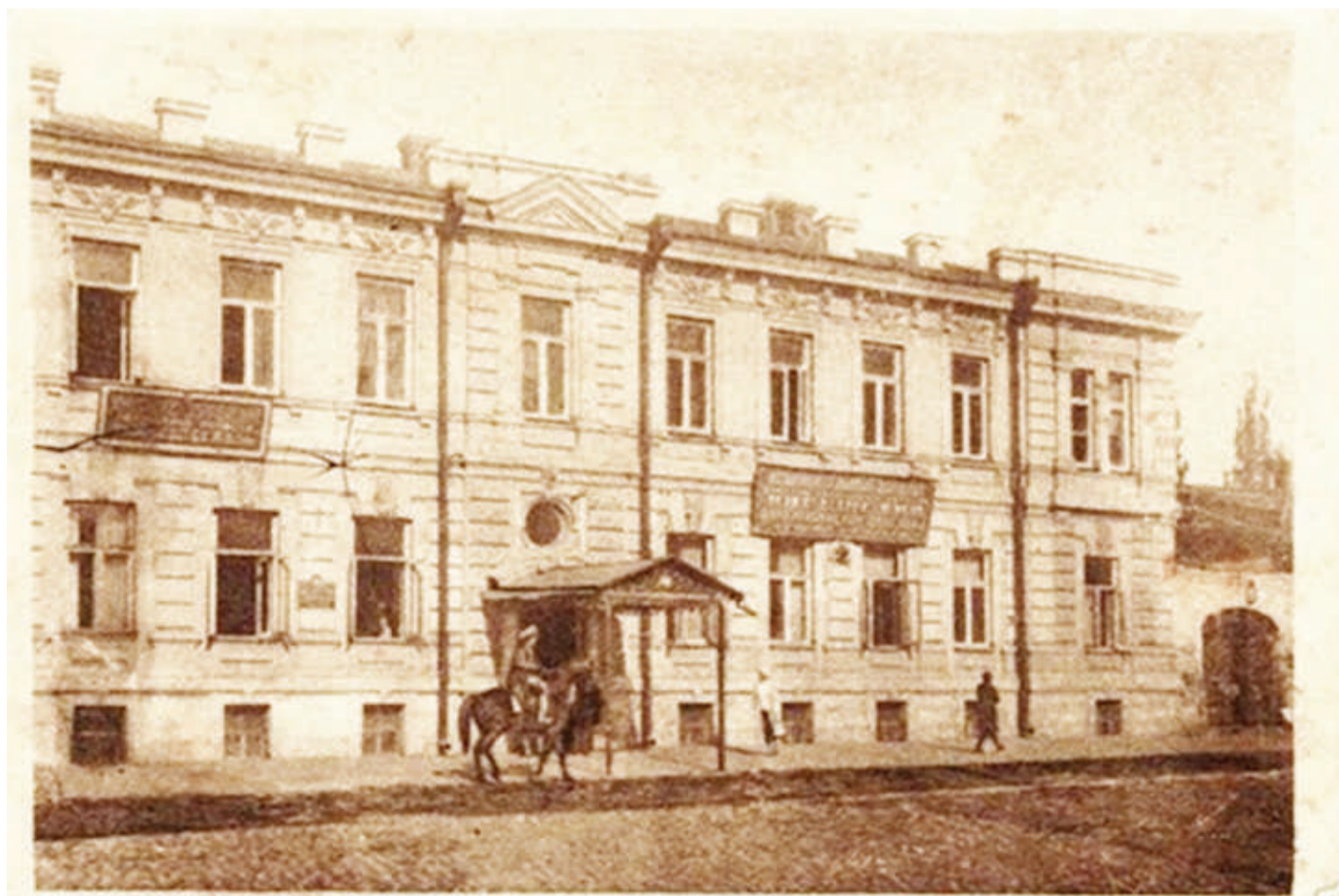
Владикавказ. Исполком Автономной области. Ингушетия

По словам министра обороны Сергея Шойгу, экипаж состоял из уникальных военных специалистов. Семьям жертв трагедии окажут всю необходимую помощь, пообещал глава военного ведомства.