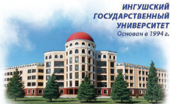
г. Магас. Главное здание университета

В этом году Ингушский государственный университет отмечает свой 25-летний юбилей. Как сообщают наши коллеги из ИнГУ, к 25-летию ФГБОУ ВО «Ингушский государственный университет» «Почта России» выпустила почтовую карточку, на которой изображено главное здание университета.