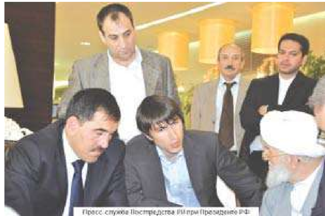
Пресс-служба Президента РФ при президенте РФ

Пресс-служба Президента Республики Ингушетия при президенте РФ