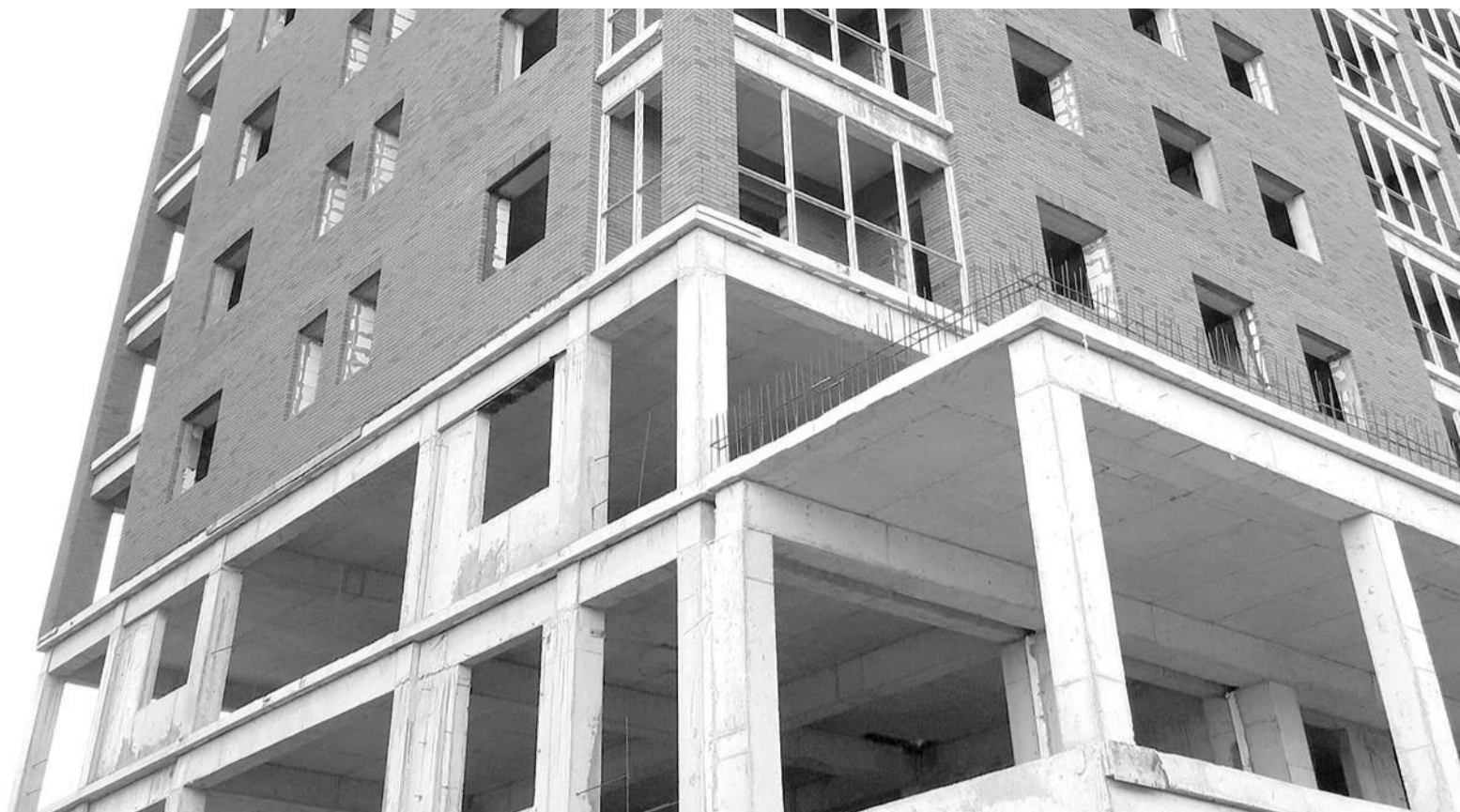
Белгалде деза, Росссе маьха лакха боаца Гишлон кхоачам хьабеш ба аьнна. Султыгнаькъан Йоакьап