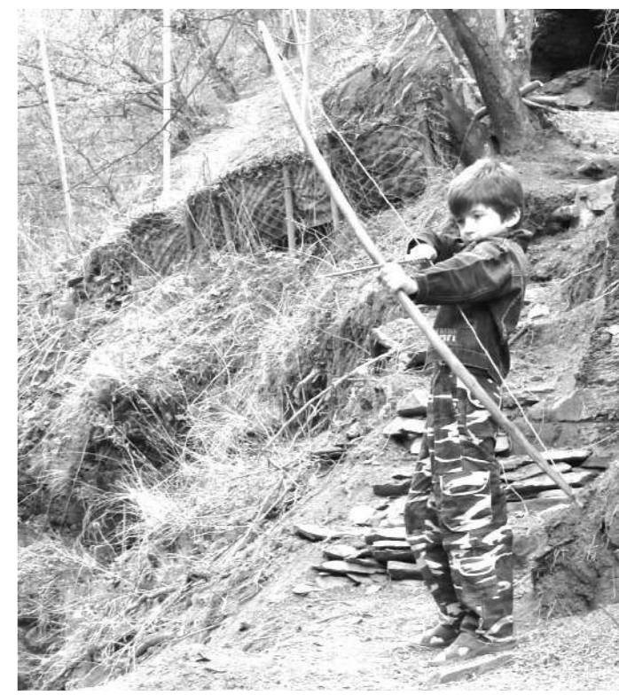
...все взрослые сначала были детьми, только мало кто из них об этом помнит.