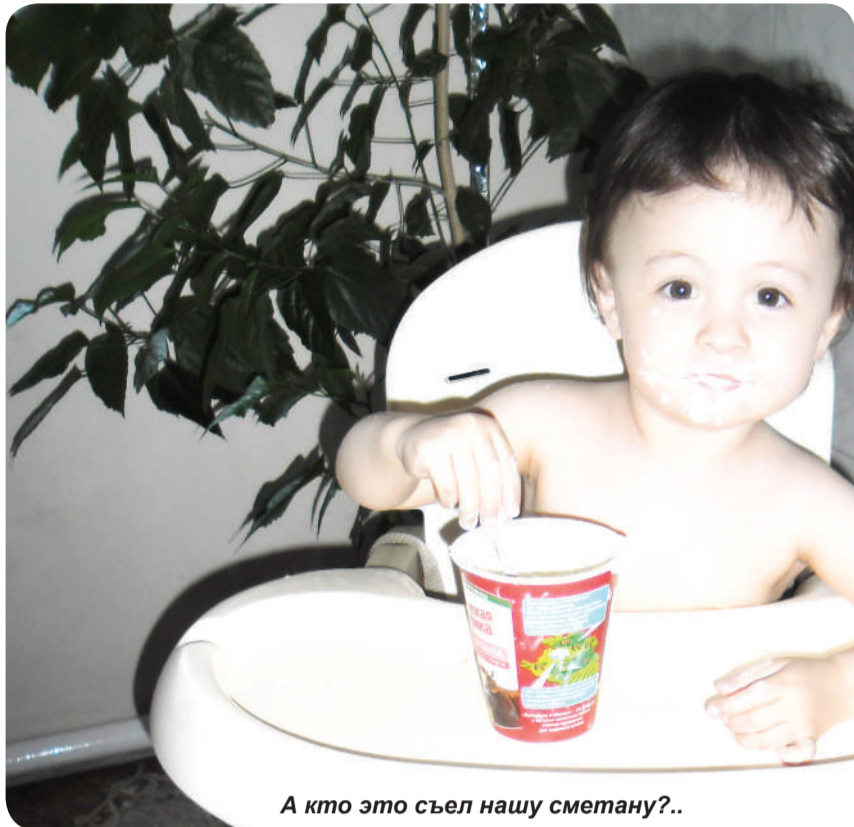
А кто это съел нашу сметану?..