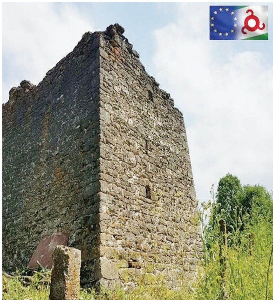
2017 год. Древнее башенное поселение «Боки-Глал» тейпа Боковых - орстхой, расположено на правом берегу реки Асса, с. Алкун Сунженского района