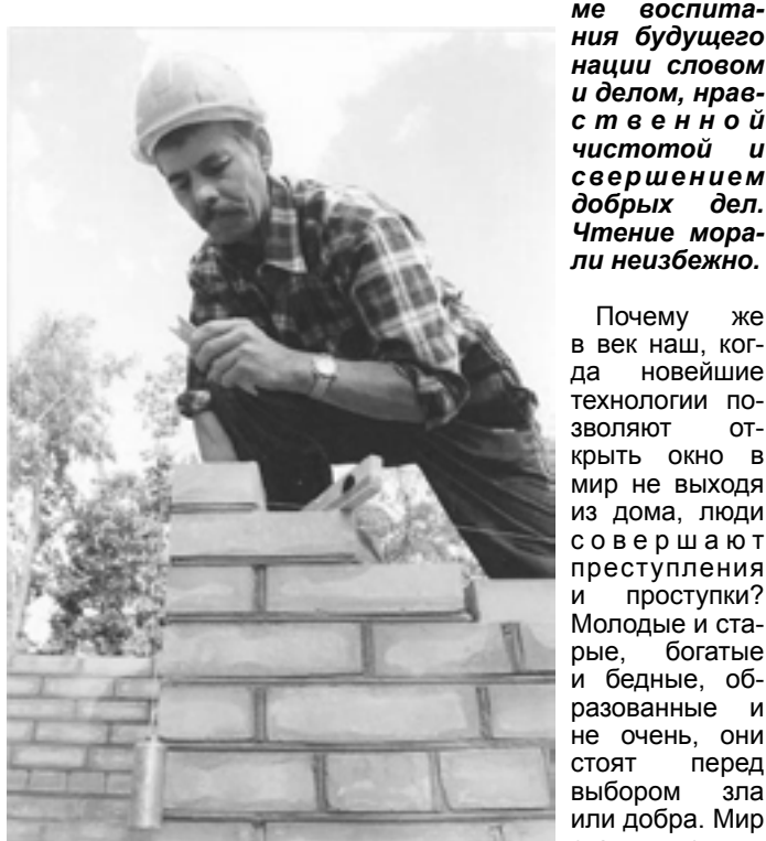
Работа каменщика сродни деятельности историка - все, что они сделали, соприкасается с жизнью множества людей, и много лет. Как мастер, так и след.

Сегодня многих из нас волнует вопрос нравственного здоровья общества, его духовного оздоровления. Он заставляет возвращаться к напечатанному, сказанному, показанному вновь и вновь. Современная ортехника позволяет получать необходимую информацию в автономном режиме не только родителям, ученым, политикам и общественным деятелям, но и подросткам, радикалам и авантюристам. Естественно, в большинстве случаев делается акцент на проблеме и воспитании подрастающего поколения.