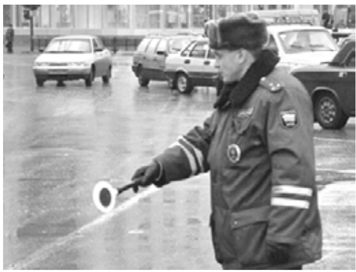
Когда за безопасностью дорожного движения следят профессионалы, безопасности больше. Когда за ней следят мздоимцы и проходимцы, количество ДТП растёт.

Сегодня многих из нас волнует вопрос нравственного здоровья общества, его духовного оздоровления. Он заставляет возвращаться к напечатанному, сказанному, показанному вновь и вновь. Современная ортехника позволяет получать необходимую информацию в автономном режиме не только родителям, ученым, политикам и общественным деятелям, но и подросткам, радикалам и авантюристам. Естественно, в большинстве случаев делается акцент на проблеме и воспитании подрастающего поколения.