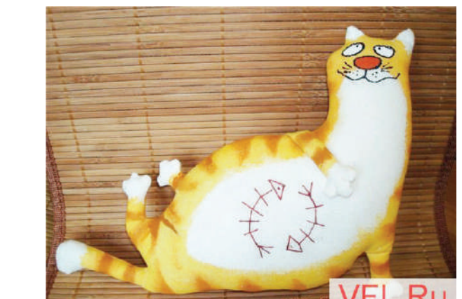
Чрезмерное чревоугодие, даже ловкого котика превращает в ленивого «бегемота».

Нельзя давать слабину, нельзя. Чтобы дети подумали, поверили, что это, впрочем, не так и страшно, подумайешь - живот растет... Однако есть машина, дом, аппаратура, земельный участок, дядя - большая шишка, мама - в правительстве, тетя - бизнесмен и т.д. и т.п. И все это очень, ну очень крутое. Это плохие примеры для тех, кто является наследником