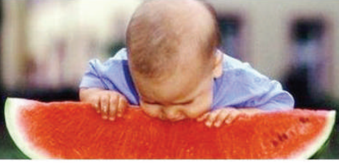
Детки распада газа; всегда проверяйте целостность корки арбуза: не должно быть даже микротрещин, не берите надрезанные арбузы (грязь легко могла попасть в ягоду, мухи и прочее); хороший арбуз имеет следующие признаки:

Опасность ранних арбузов состоит в том, что, для того чтобы ускорить созревание, их растят под пленкой - так достигается нужная температура, арбуз становится спелым уже через два месяца после посадки, к середине лета. Но за столь короткое время сладкие ягоды не успевают избавиться от накопленных нитратов, которые присутствуют в удобрениях, необходимых для правильного роста.