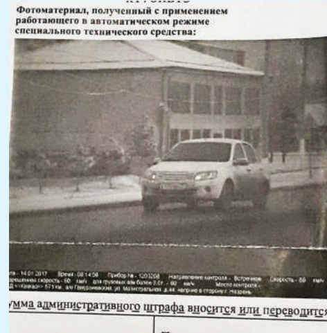
Фотоматериал, полученный с применением работающего в автоматическом режиме специального технического средства.

Первые эмоции и впечатления после получения бумаги из ГИБДД были крайне досадные. А затем быстро пришло не только осознание, но и совершенно искреннее чувство благодарности тем, кто зафиксировал мое правонарушение. Почему? Да прежде всего потому, что я вовремя остановился, не стал спорить, а сразу оплатил штраф. И это, пожалуй, самый полезный совет от ГИБДД Ингушетии: будьте внимательны на дороге, соблюдайте ПДД, и вы избежите неприятных ситуаций.