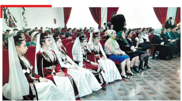
ЛИТЕРАТУРА ГалгIай йоазон бIаь шу дизарга