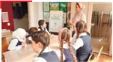
ВОШАЛ ГалгIайче Россех дIакхетара хъакъехъа къамаьл дир Яндарерча культуран ЦIагIа