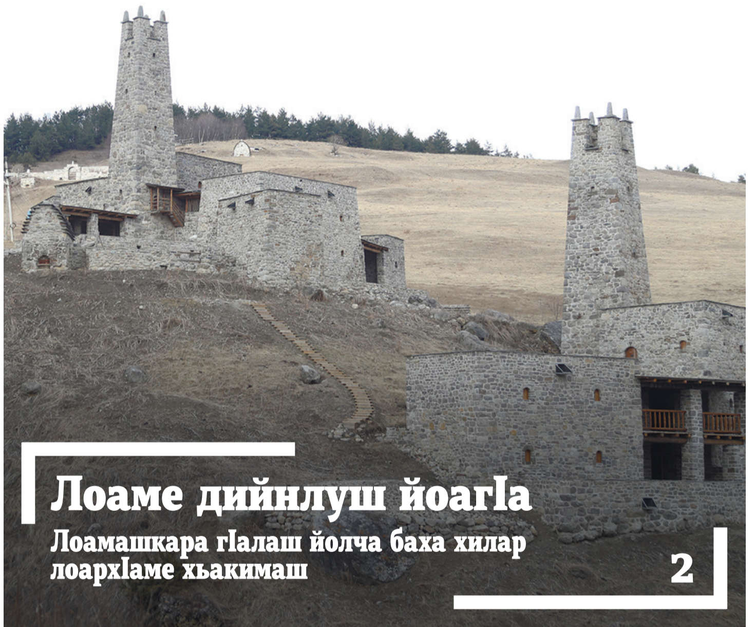
Лоаме дийнлуш йоагIа Лоамашкара гIалаш йолча баха хилар лоархIаме хъакимаш

www.serdalo.ru @gserdalo vk.com/gserdalo Дзен сердало