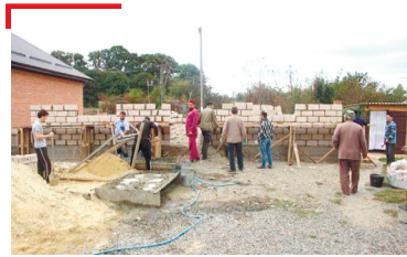
IАДАТАШ Белхий беш хинна ханаш