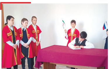
ДАБХЕН СИЙЛЕ Дешархошта дийцар ГалгIайче Россех дIакхетарах