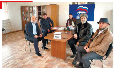
НАБХА ХЪАШТАШ Парламента депутаташ бахархой тIаийбеш хилар

Газет арадувл 1923-ча шера бекарга бетта 1-ча дийнахъа денз 1973-ча шера «Сердало» газета «Знак почета» яха орден еннай