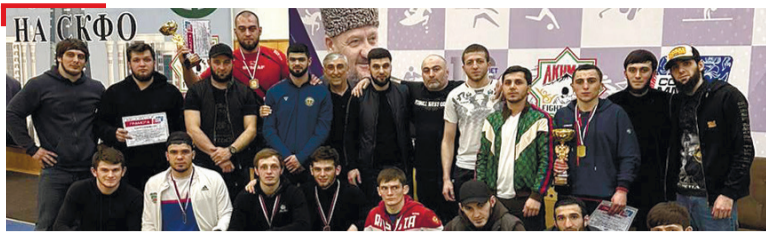
СПОРТ ГалгIай спортсменаша ММА яхъашка 10 майдилг яьккхар