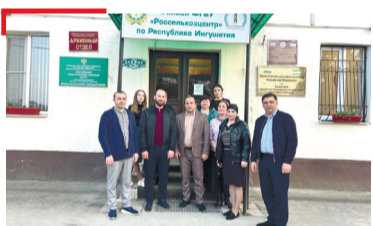
ЮРТБОАХАМ Къарший-Черсий мехкара РСХIЦ болхлой кхаьчар вай мехка