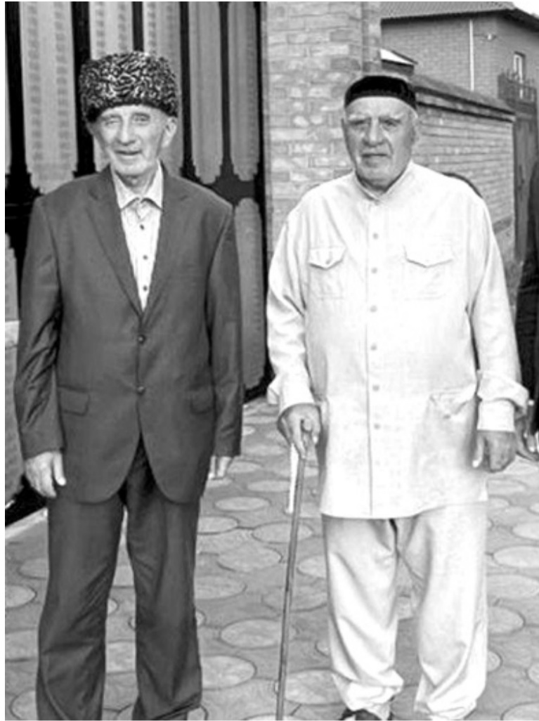
Иаддал-Салами цун воккхалгвола воша Оарцхон

Дуккха лоархлеме а сакъердаме а влшагйахетараш хиннад Иаддал-Салама, тайптайпарча балхаш тла волча