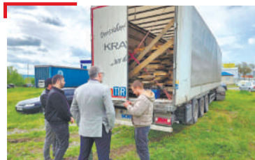
ИАЛАМ Хьун гулакх лораде деза