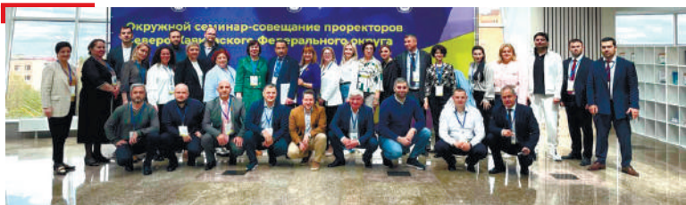
КХЕТАЧЕ Йоккха кхетаче д'айихьар