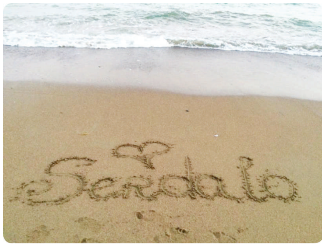
"Не нужен мне берег турецкий, родную газету мне дай!.."