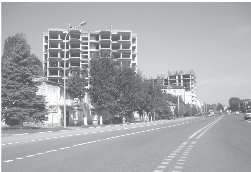
Назрань за последние годы строится, благоустраивается, становится чище и хорошеет.

Проложено и прокладывается много асфальтированных дорог и тротуаров на центральных улицах. Параллельно высаживаются саженцы декоративных деревьев, кустарники и цветы. Преображается проспект имени Базоркина, на котором интересно стало отдохнуть, совершить прогулку. Особое внимание привлекают два строящиеся высотные здания, которые на фоне старых пятиэтажек кажутся почти небоскребами, заметно выделяясь своими