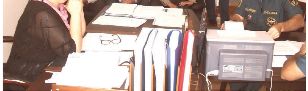
3 сентября занятия в гимназии № 1 начались с эвакуации. Отдел надзорной деятельности с Карабулака совместно с работниками пожарной части № 4 провели тренировки по эвакуации людей в случае пожара из здания гимназии.

Такие учения полезны как для учеников, так и для педагогов. В реальной ситуации, даже растерявшись, у людей включается механическая память, они начинают действовать и двигаться по заученной схеме. И учителю будет легче контролировать школьников, особенно малышей, достаточно